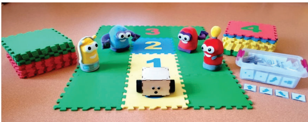
Рис. 1. Учебно-методический набор «ПиктоМир»

2. Физические игрушки. Использование конструкторов и игрушек позволяет детям экспериментировать с различными формами и структурами, что способствует развитию пространственного мышления (см. рис. 1).