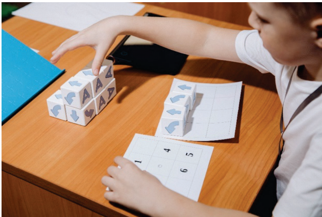
Рис. 3. Ребенок составляют алгоритм из пиктокубиков

Игра. Игра является ключевым аспектом дошкольного образования. Игровая форма обучения является мощным инструментом для развития алгоритмического мышления у дошкольников. ПиктоМир включает в себя множество игровых заданий, которые делают процесс обучения увлекательным и мотивирующим. Дети учатся решать задачи в контексте игры, что снижает уровень стресса и повышает их готовность к экспериментам.