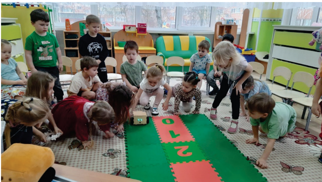
Рис. 2. Дети управляют реальным роботом Ползуном на поле, собранном из цветных клеток-ковриков

2. Цветовые коды: использование ярких визуальных элементов помогает детям лучше понимать и осваивать алгоритмические процессы. Например, цветные коврики (см. рис. 2), мягкие игрушки, пиктокарточки и пиктокубики (см. рис. 3) могут быть использованы для создания реальных полей для роботов и составления программ управления роботами, что делает абстрактные для ребенка понятия более доступными для восприятия.